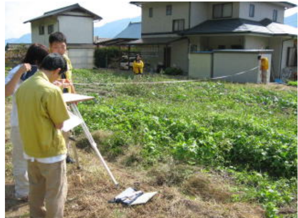
⑤それを繰り返していきます。