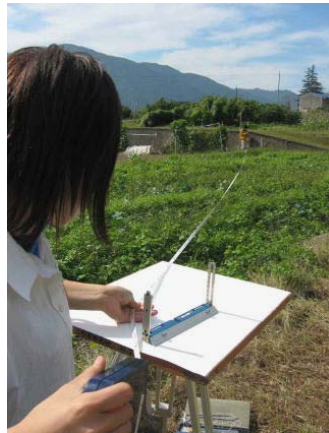
④方向と距離を測ります。