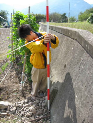
③境にポールを立てます。