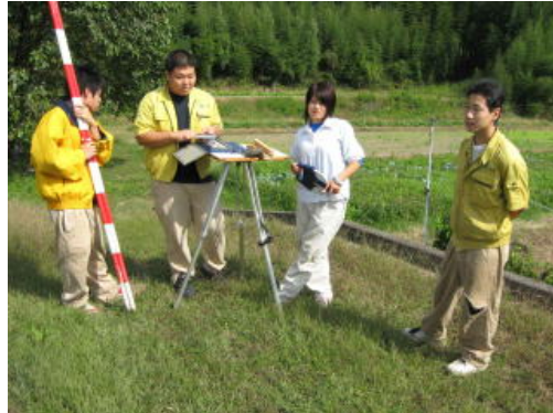
森林環境コースの授業です。