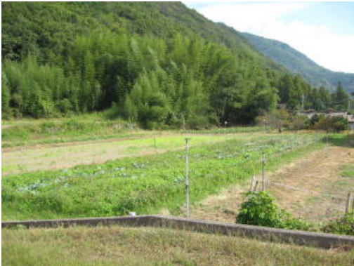
今回の場所は敷地農場です。