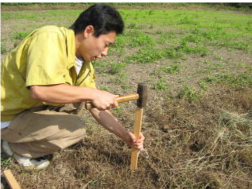
①杭を打ち込み基準点を作ります。